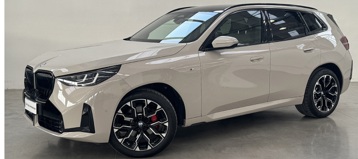
Tullo Pezzo Jahreswagen

*Offerta valida con adesione 4 anni Polizza Furto e Pacchetto Tullo Pezzo senza pensieri