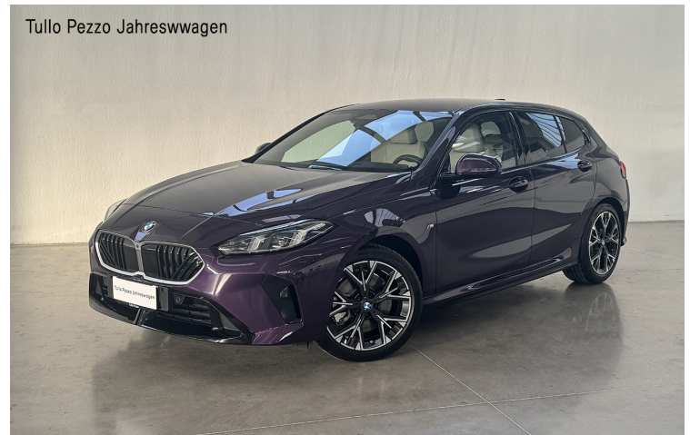
Tullo Pezzo Jahreswagen

Listino € 59.800 - Ns prezzo € 39.000+iva - Vantaggio Cliente € 12.220 *Offerta valida con adesione 4 anni Polizza Furto e Pacchetto Tullo Pezzo Senza Pensieri.